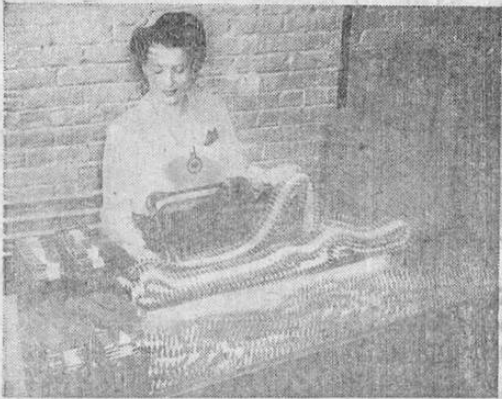
En los Estados Unidos se celebró el 4 de julio, día de la independencia nacional, trabajando en las fábricas para producir las armas que han de asegurar, una vez por todas, la libertad de individuos y naciones. En la fotografía, una graciosa obrera empaca cinturones de municiones de ametralladora.